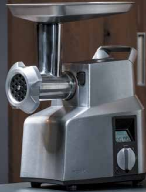
МЯСОРУБКА М700 РУКОВОДСТВО ПОЛЬЗОВАТЕЛЯ