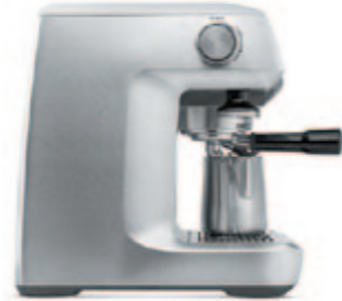
КОФЕЙНАЯ СТАНЦИЯ C802