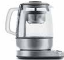
ЧАЙНИК K 810