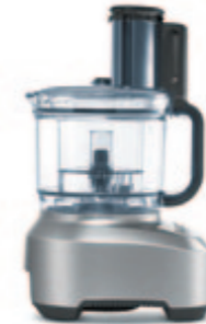
КУХОННЫЙ КОМБАЙН B801