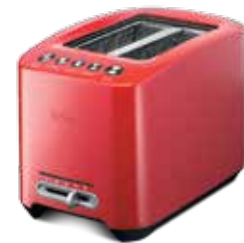
T802 — красный