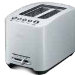
T803 — белый