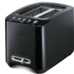
T801 — черный