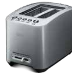
T800 — серебристый