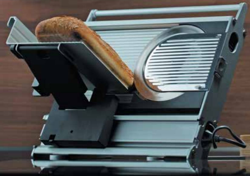
ЛОМТЕРЕЗКА Z780 РУКОВОДСТВО ПОЛЬЗОВАТЕЛЯ