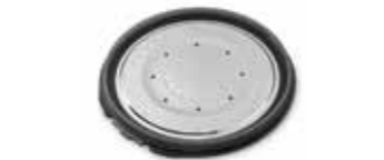
Съемная крышка с уплотнителем